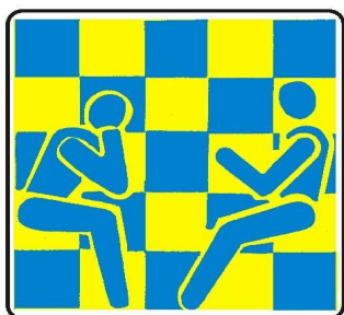
Club 64 Modena