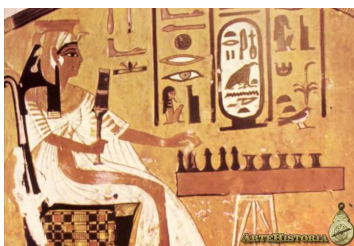
Reina Nefertari XIXª dinastía

Leyendo uno de los pasajes más notables de las tragedias de los clásicos universales como lo es el de la obra de Eurípides , Ifigenia en Aulide , pude observar una vez más la relación entre la literatura y el noble arte ajedrecístico. Haciendo abstracción de los acontecimientos que en él se relatan vívidamente en los sucesos trágicos del sitio de Troya en donde el rey Agamenón siguiendo el dictado de los dioses y satisfaciendo a su ejército que esperaba el sacrificio que favoreciera vientos favorables que permitieran zarpar a la armada griega en dirección a Troya, aquel no trepida, con ignominioso subterfugio, atraer a su propia hija para ofrecerla en sacrificio, en aras de Diana , como una forma de salvar su reinado y por ende sus ansias de poder y de gloria.