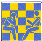
Club 64 A.S.D. Modena

Ritrovo ogni martedì-giovedì sera (ore 21-00.30) e ogni sabato (ore 15-19) presso la sede della Pol.S.Faustino, Via Wiligelmo 72.